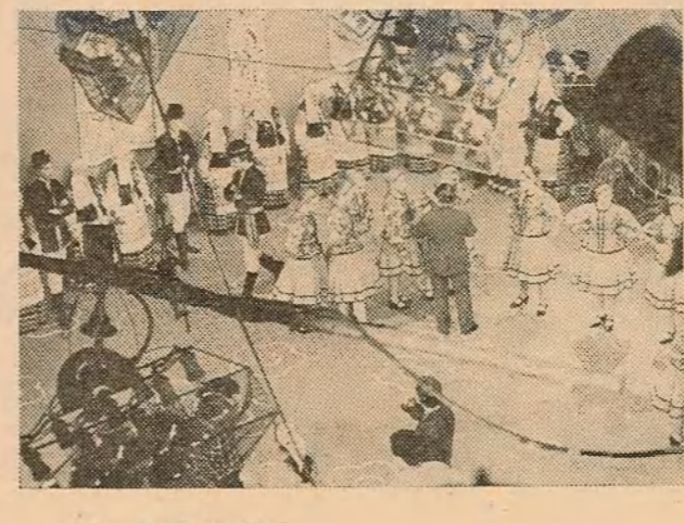
НА ЗДЫМКАХ: апошнія парады перад выходам на сцэну дас кіраўнік ансамбля М. Лапша; у віхоры танца ансамбль рыхтуецца да выступлення на тэлебачанні.